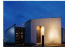
Stairwell ~吹抜・中庭がある家~