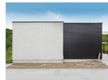
スローライフを満喫する家