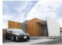
Cut eyes - プライバシーが守られた家