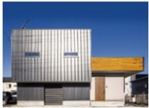
Up to door