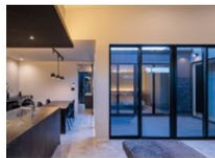
Cool Gallery ~家に見えない家~