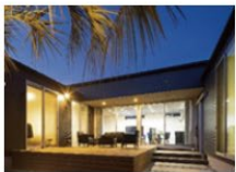
素材が光る コの字型の平屋