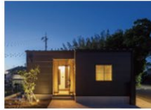
Coexistence of vintage and modern