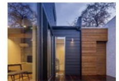
In town -街中に佇む家-